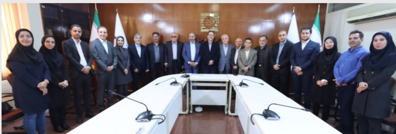
تصویر مراسم گرامیداشت بیستمین سال انتشار نشریه پژوهش‌های حقوقی و دهمین سال انتشار نشریه پژوهش‌های حقوق جزا و جرم‌شناسی - ۲۰ مهر ۱۴۰۲

یکی از ویژگی‌های منحصر به فرد پژوهشکده حقوقی شهر دانش، امتیاز و انتشار پنج نشریه با سیاست‌ها و گرایش‌های مختلف حقوقی است که دو نشریه آن از سال‌ها پیش دارای درجه علمی-پژوهشی هستند؛ این نشریات با بزرگترین حقوقدانان کشور ارتباط مستمر و حرفه‌ای دارند و هم در معرض آشنایی و همکاری علمی با شاخص‌ترین اندیشه‌های حقوقی و اندیشه‌ورزان در سطح کشور قرار دارد. همچنین دو نشریه دیگر آن نامزد دریافت درجه علمی هستند که امیدواریم به‌زودی این درجه را کسب نمایند. البته در حال حاضر طبق آیین‌نامه وزارت علوم، تحقیقات و فناوری، این نشریات دارای اعتبار علمی هستند و مقالات علمی - پژوهشی (بر اساس تشخیص داوران در مرحله داوری) قابل انتشار خواهد بود و نوع مقاله (علمی - پژوهشی) در صفحه نخست هر مقاله ذکر می‌گردد. این نشریات در پایگاه استنادی علوم جهان اسلام (ISC)، دوآج (DOAJ)، ایندکس کوپرنیکوس (Index Copernicus)، نورمگز (Noormags) و مگیران (Magiran) نمایه می‌شوند. نشریه پنجم، جامعه وسیع‌تری را مخاطب قرار داده و از جنبه اطلاع‌رسانی نیز برخوردار است و مطالب آن از محتوایات تولیدشده توسط باشگاه اندیشه‌های حقوقی و یا کتابخانه و مرکز اطلاع‌رسانی پژوهشکده تأمین می‌شود.