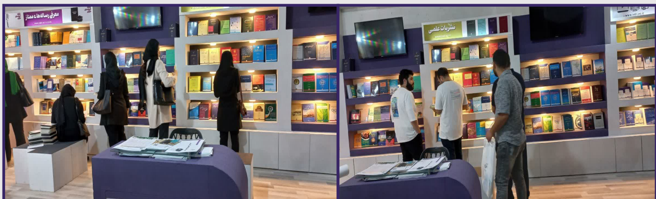
غرفه انتشارات پژوهشکده حقوقی شهر دانش در نمایشگاه بین‌المللی کتاب تهران - اردیبهشت ۱۴۰۳

در امور کیفری» پاییز ۱۳۸۹، کتاب شایسته تقدیر سیزدهمین دوره جایزه کتاب فصل «تمایز بنیادین حقوق مدنی و حقوق کیفری» بهار ۱۳۸۹، کتاب شایسته تقدیر نهمین دوره جایزه کتاب فصل «حقوق بشر در جهان معاصر: جستارهایی تحلیلی از حق‌ها و آزادی‌ها» بهار ۱۳۸۸، کتاب برگزیده هشتمین دوره جایزه کتاب فصل «دادرسی عادلانه: محاکمات کیفری بین‌المللی» زمستان ۱۳۸۷، کتاب شایسته تقدیر در بیست و هفتمین دوره جایزه کتاب فصل «نظریه عمومی سیاستگذاری جنایی» پاییز ۱۳۹۲، کتاب شایسته تقدیر در بیست و هفتمین دوره جایزه کتاب فصل «قیاس در استدلال حقوقی» پاییز ۱۳۹۲، کتاب شایسته تقدیر بنیاد حفظ آثار و نشر ارزش‌های دفاع مقدس «تأملی بر حقوق بی‌طرفی در جنگ تحمیلی عراق علیه ایران»، کتاب برگزیده در ششمین جشنواره پژوهش‌های برتر مالیاتی و مالیه عمومی «اصل برابری و حقوق مالیاتی در آینه حقوق بشر» بهمن ۱۳۹۰، رتبه اول (کتاب برتر) هفتمین دوره کتاب سال دانشجویی «حقوق بین‌الملل اقتصادی» را به خود اختصاص داده‌اند. انتشارات پژوهشکده حقوقی شهر دانش در سی و پنجمین نمایشگاه بین‌المللی کتاب تهران، جایزه بهترین ناشر دانشگاهی را دریافت کرد. انتشارات شهر دانش این آمادگی را دارد تا طرح‌های پژوهشی که در واحد مدیریت جذب و اجرای طرح‌های پژوهشی برای سازمان‌ها و نهادهای همکار به سرانجام می‌رسد را در قالب کتاب منتشر سازد. همچنین از انتشار آثار علمی مؤلفان که واجد جنبه پژوهشی و نوآوری باشد استقبال می‌کند. اغلب آثار منتشره توسط مؤلفان و یا ناقدان به طور ویدیویی معرفی شده‌اند که از طریق لینک https://sdil.ac.ir/books/ در دسترس هستند.