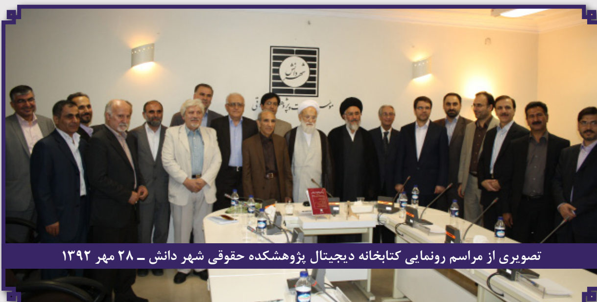
تصویری از مراسم رونمایی کتابخانه دیجیتال پژوهشکده حقوقی شهر دانش - ۲۸ مهر ۱۳۹۲

بدین ترتیب در سال ۱۳۹۲ و به همت پژوهشکده حقوقی شهر دانش، نخستین کتابخانه دیجیتال حقوق در کشور با حضور جمعی از اساتید حقوق ایران به بهره‌برداری رسید. مجموعه‌ای از متن کامل منابع حقوقی و حوزه‌های مرتبط با حقوق در قالب کتاب، مقاله، پایان‌نامه و رساله‌های فارسی و غیرفارسی که با استفاده از اینترنت و فناوری‌های الکترونیک قابل دسترس است. موجودی کتابخانه دیجیتال تا ابتدای سال ۱۴۰۳، به بیش از ۲۲۶,۰۰۰ منبع الکترونیک می‌رسد که شامل بیش از ۸,۰۰۰ کتاب، ۲۰۴,۰۰۰ مقاله و ۲,۰۰۰ پایان‌نامه و رساله است و هرساله بر تعداد آن افزوده می‌شود. استقبال دانش‌پژوهان از سراسر کشور از این کتابخانه، مشوق تداوم توسعه آن است و آن را به یکی از مهم‌ترین ذخایر علمی در رشته حقوق بخصوص برای دسترسی به آخرین تحقیقات در سطح جهان بدل ساخته است.