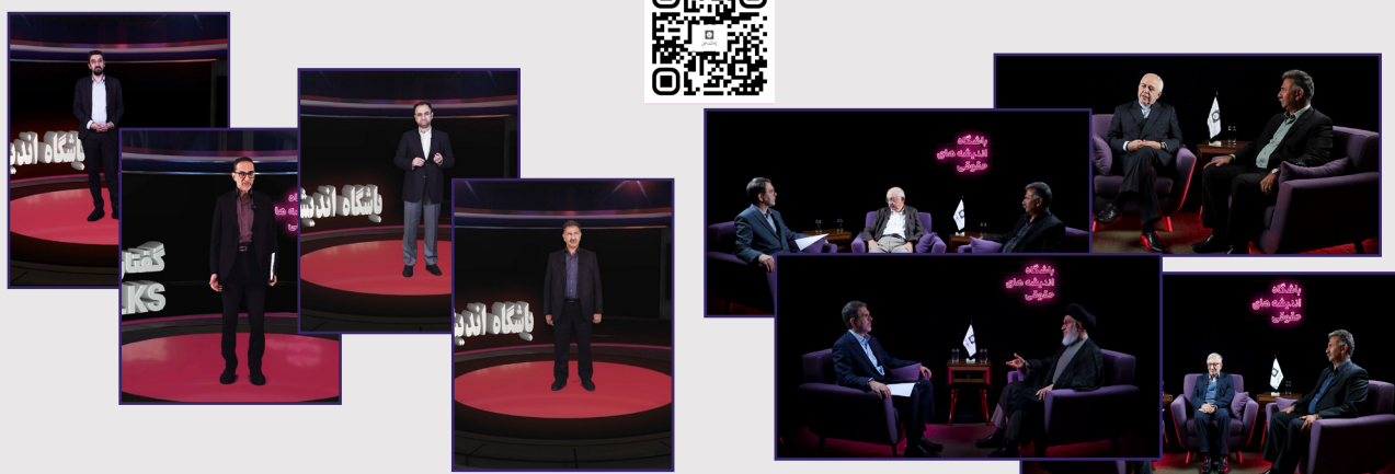
گفتارهای حقوقی (Law Talks)